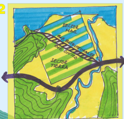
El desvío del tránsito pesado por el Sur convierte la antigua vía en eje intermedio estructurante o eje Cívico.