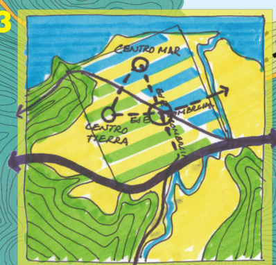
Un Centro Cívico y dos Centros Comunales (El Mar y la Tierra) unidos por tres ejes comerciales.