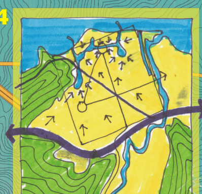
Sistema interno de canales de navegación y de regulación de drenajes.