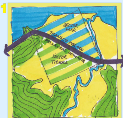
La vía de tránsito pesado entre Cumaná y Puerto la Cruz separa el sector "Mar" del pueblo del sector "Tierra".