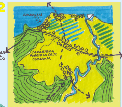
1950 Construcción de la vía Puerto la Cruz - Cumaná. Temporadistas construyen sus casas en Playa Cochaíma. El pueblo se extiende a lo largo de la carretera.