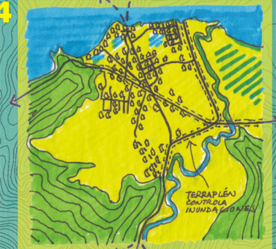
1970 Construcción del terraplen para contener las crecidas del río. Las ciénagas son rellenadas de tierra. El pueblo ocupa el valle.