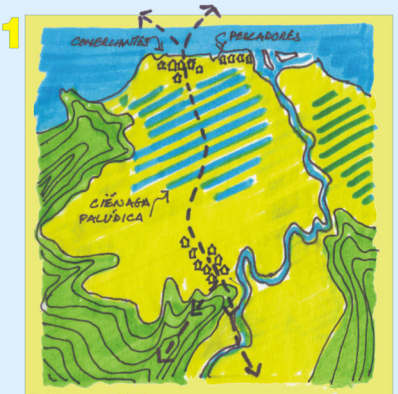
1613 - 1950 Santa Fe puerto activo pero caserío pequeño debido a la insalubridad del Delta.