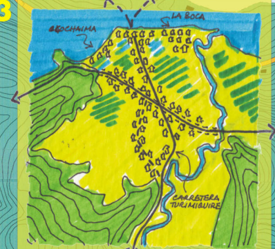
1960 Construcción de la vía hacia el sur. Los campesinos se instalan en el pueblo.