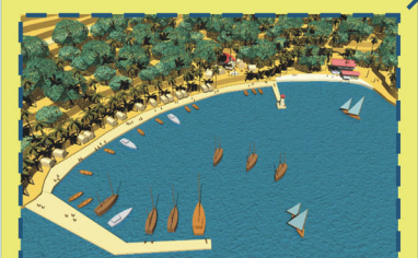
FONDEADERO DE VELEROS

Para reducir el impacto ambiental y el congestionamiento de la playa de Santa Fe, se propone concentrar veleros y yates en un fondeadero, que a su vez es centro de estudios marinos y sede de la Fundación Fundaremar, dando cabida también a carpinterías artesanales, pueblo de pescadores, museo del mar y una posada.